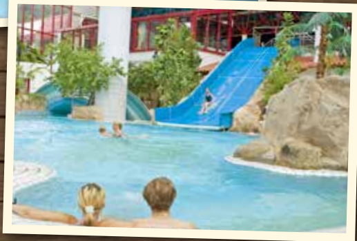
Abbildung oben: Kirchberg-Therme; unten: Vitamar